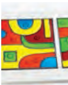
VIDRIO DÍPTICO "Abstracción geométrica"