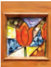
VIDRIO "Respaldos de cama"